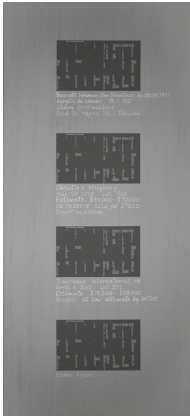
Home Again , 2013, acrylique et huile sur toile, 74,3 x 127 cm acrylic and oil on canvas, 108 x 50 inches