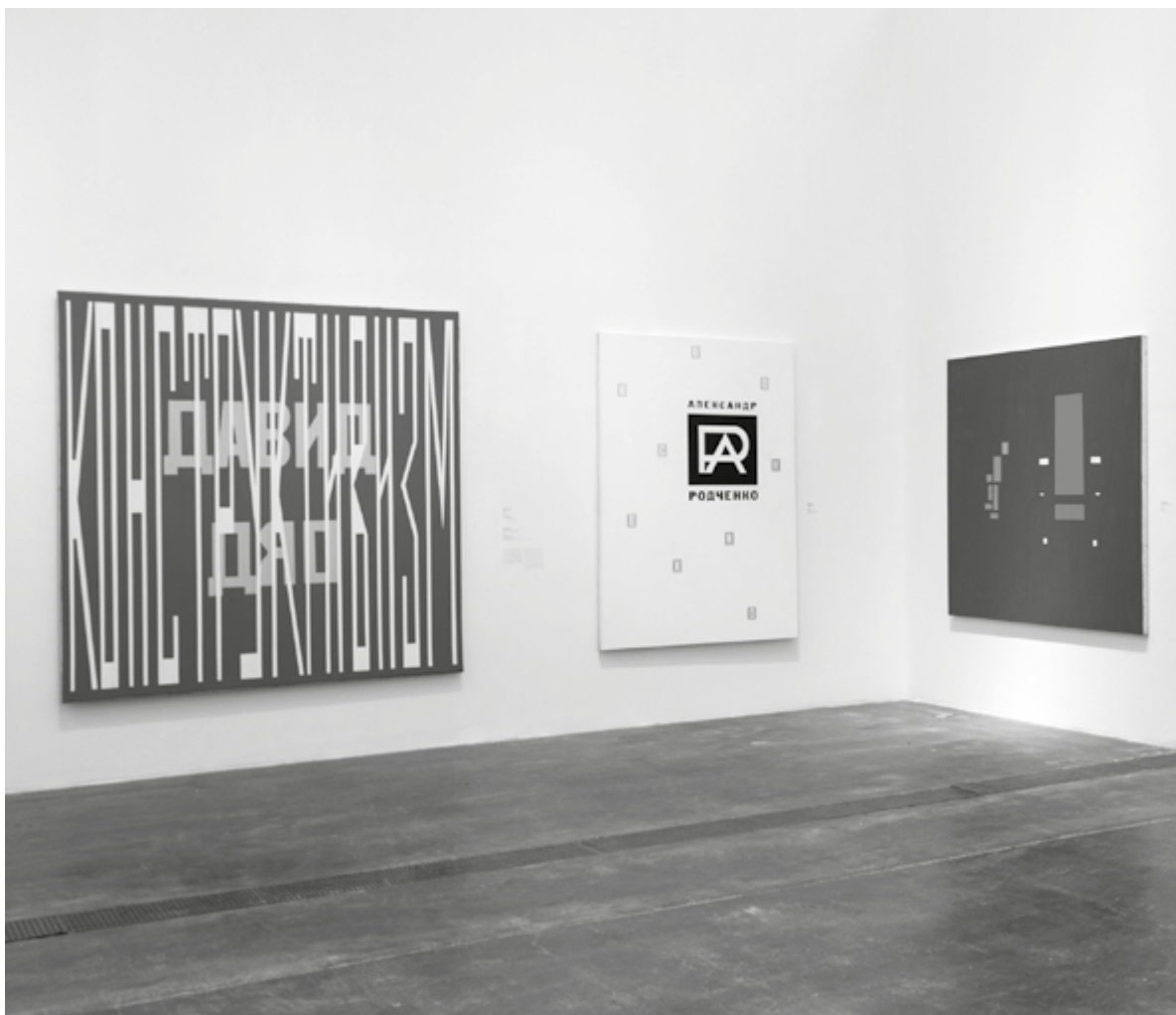
Vue d'installation, « David Diao », UCCA Pekin, 2015 Installation view of « David Diao » at UCCA Beijing, 2015