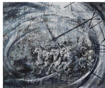
Tanya Vasilenko, Temps inversé , peinture acrylique sur toile, 150 × 180 cm, 2017 (Ukraine).

Nathalie BITTINGER (cinéma), Geneviève JOLLY (arts du spectacle)